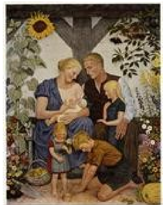
La peinture d'une famille allemande « parfaite »